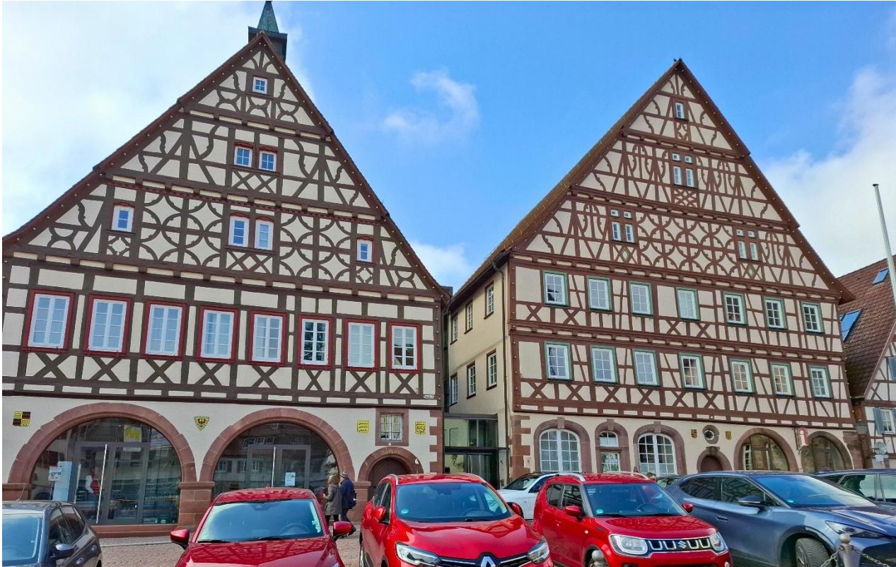
Altes Rathaus, früher Gaststätte zum Ochsen, daneben die Tourist Info