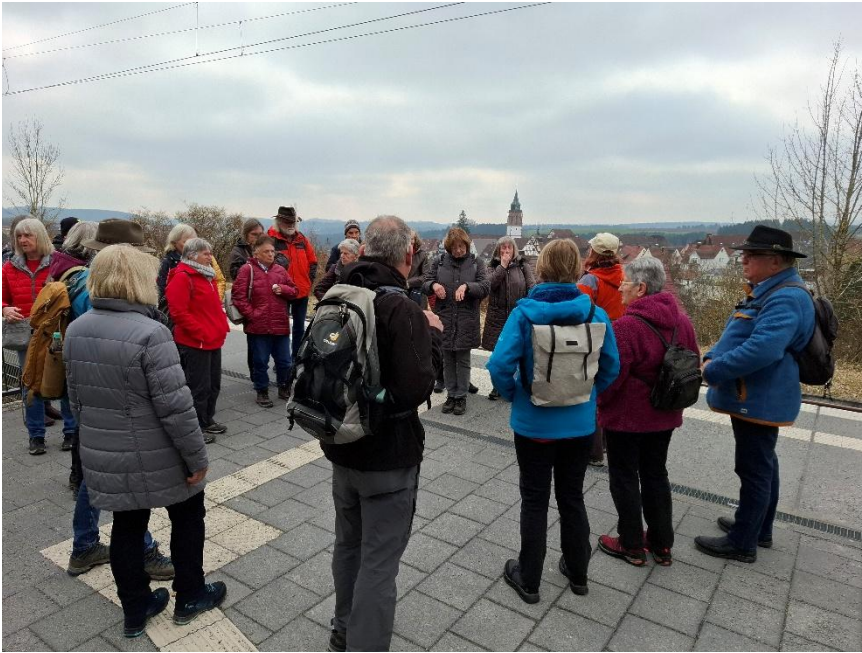
Am Bahnhof in Dornstetten